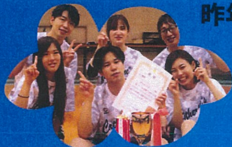
昨年度チャンピオン